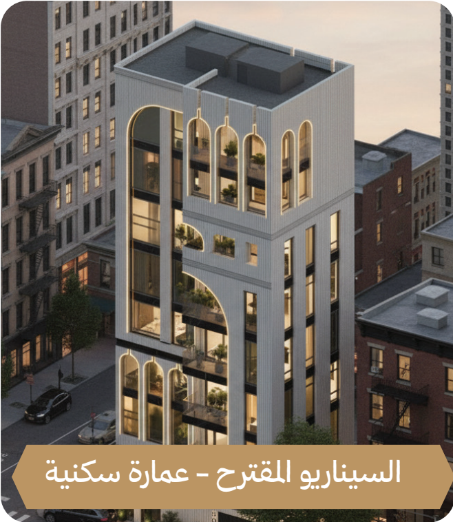
السيناريو المقترح - عمارة سكنية