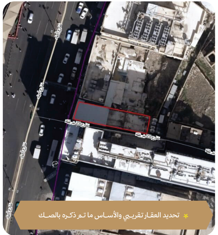
* تحديد العقار تقريبي والأساس ما تم ذكره بالصك