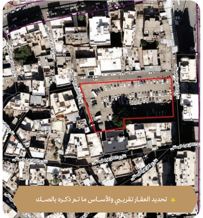
* تحديد العقار تقريبي والأساس ما تم ذكره بالصك